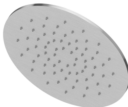
Portata Flow rate